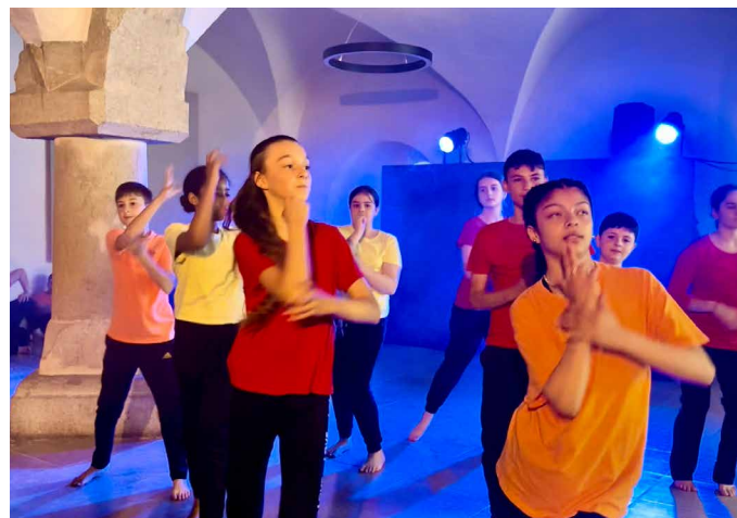
Abschlussaufführung vom 11. Mai 2023 im Theaterfoyer Biel